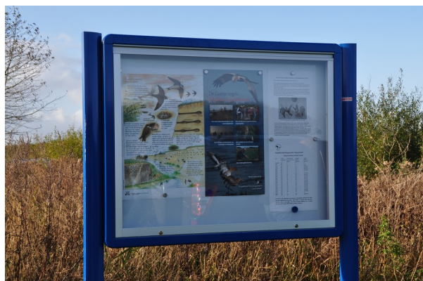
Het nieuwe infopaneel bij het kijkpunt

Door Recreatieschap Het Twiske is in november een geheel nieuw infopaneel geplaatst bij het kijkpunt tegenover de wand. Dit prachtige aluminium paneel is meteen gevuld met alle informatie tot en met het broedseizoen 2017 en tevens is alle info vernieuwd. Met dank aan Het Twiske en met name aan buitendienst-medewerker Marco Woudstra.